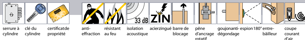
serrure à cylindre